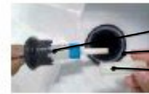
Aromatherapie-Stick Aromatherapie-Stickhalter Verschlussdeckel

Drehen Sie die Abdeckung, gegen den Uhrzeigersinn zu öffnen.